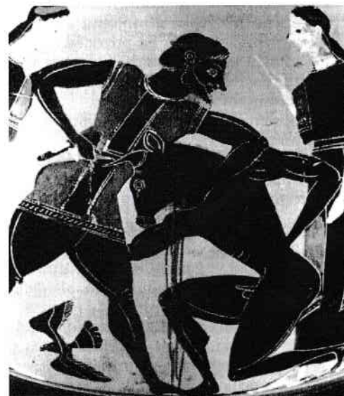
Tezeu intră cu ajutorul Ariadnei în Labirintul din Cnossos și îl învinge pe Minotaur. Pictură antică pe un vas, circa 540 î.Hr.

Nu peste multă vreme, regele a fost din nou lovit de soartă. Fiul lui iubit, Androgeos, era plecat la Atena pentru a participa la concursurile sportive. Era de născut învingătorul pentatlon, unde nu avea rival. Învingătorii nu s-au putut împăca cu soarta și l-au ucis. Minos, sfâșiat de durere, și-a trimis flota împotriva Atenei pentru a se răzbuna pe criminali. Atena a fost înfrântă și a trebuit să cedeze în fața învingătorului, care a cerut jertfe umane. La fiecare nouă ani, 14 copii, șapte băieți și șapte fete, trebuiau trimiși în Creta, unde erau aruncați în Labirint ca mâncare pentru Minotaur. Atena a plătit mult timp acest tribut, până ce Tezeu, fiul regelui Egeus, a plecat benevol cu victimele în Creta. Tatălui său i-a promis că va întinde o velă albă, dacă se va întoarce victorios din lupta cu Minotaurul.