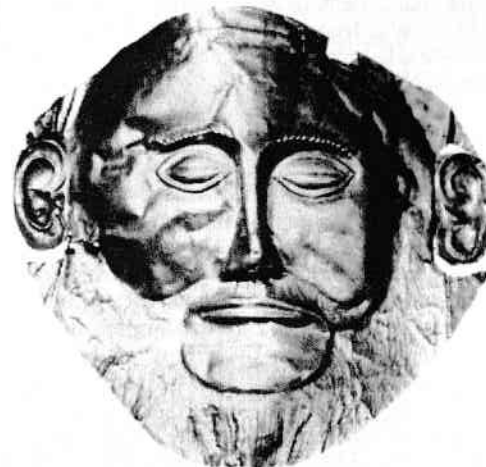
Heinrich Schliemann a avut deseori norocul de partea lui la săpăturile de la Micene. Această mască mortuară din aur putea fi, după el, „masca lui Agamemnon”, dar s-a înșelat.

Cât de adevărată a fost intuiția lui cu privire la Creta s-a văzut numai după ce englezul Arthur Evans a sosit pe insulă, câțiva ani mai târziu. Raporturile politice s-au schimbat radical în 1898, când Creta a dobândit autonomie.