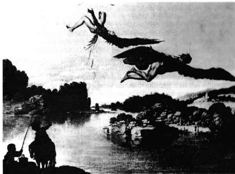
În închisoare, Dedal a făcut aripi pentru el și pentru fiul său Icar și a încercat să scape din insulă. Icar s-a apropiat prea mult de Soare și a căzut (pictură de Carlo Saraceni, sec. XVI/XVII).

Potrivit legendei, Minos se retrage în lumea umbrelor și stă acolo pe tron pentru a-i judeca pe morți. După câteva secole, din înțeleptul Minos literatura greacă a făcut un spirit al răului. Strălucitoarea Atenă nu a putut admite că altădată era tributară puternicei Crete. Deci legenda a fost rescrisă. Filosoful și naturalistul Aristotel, profesorul lui Alexandru cel Mare, căzut ulterior în dizgrație la greci, se îndoia de imaginea regelui Minos din timpul lui: „Poeții noștri i-au atribuit întotdeauna un prost renume lui Minos, iar pe scenele antice era mereu minimalizat. Nu a fost salvat de faptul că Hesiod l-a denumit cel mai bun dintre regi și nici că Homer îl considera un om de încredere al lui Zeus.