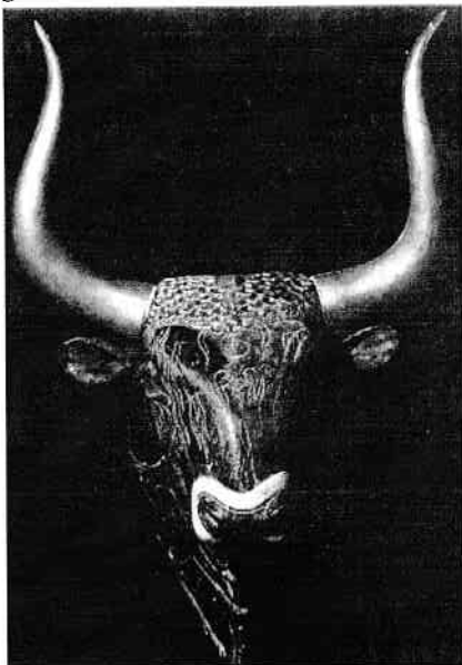
În religia cretană, taurul a jucat un rol important. După mii de ani, acest cap de taur a fost readus la lumină.

Schliemann nu s-a declarat satisfăcut de descoperirile lui senzaționale. A plecat în Creta pentru a căuta acolo palatul legendarului rege Minos.